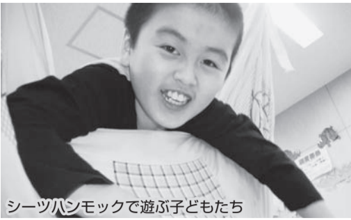
シートハンモックで遊ぶ子どもたち

子どもたちには、学校と家で過ごす時間と同じくらい放課後の時間があります。この放課後の時間を充実させていくためにも活動の場が必要になります。その活動の場としてコスモス地域福祉活