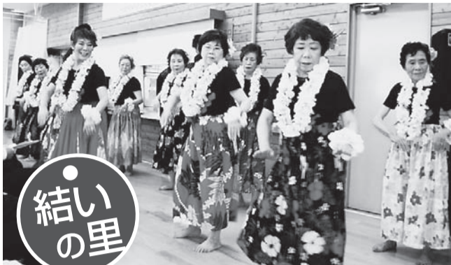
地域の方々によるフラダンスです

10周年記念式典を おこないました 地域のの方々、利用者、家族のみなさんに支えられ結いの里は10周年を迎えることができました。関係者同感謝申し上げます。地域の皆さまが高齢になられても安心して住みなれた街で暮らし続けられるよう職員一同努力してまいります。 昨年12月19日には、10周年記念式典を行いました。地域の皆さまがフラダンスを披露してくださったりみなさんで歌を歌ったりとても楽しい時間となりました。 今後も地域の皆さまとのネットワークも大切にしながら「この街に住んでいて良かった」と思ってもらえるような地域づくりを目指していきます。