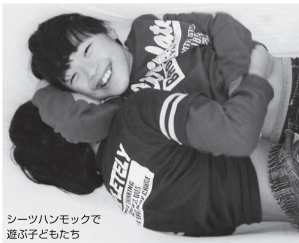
シーツハンモックで遊ぶ子どもたち

特定非営利活動法人 子ども・若者支援ネットワークおおさか 南河内郡千早赤阪村大字森屋956番地の1 ☎ 0721(72)1556